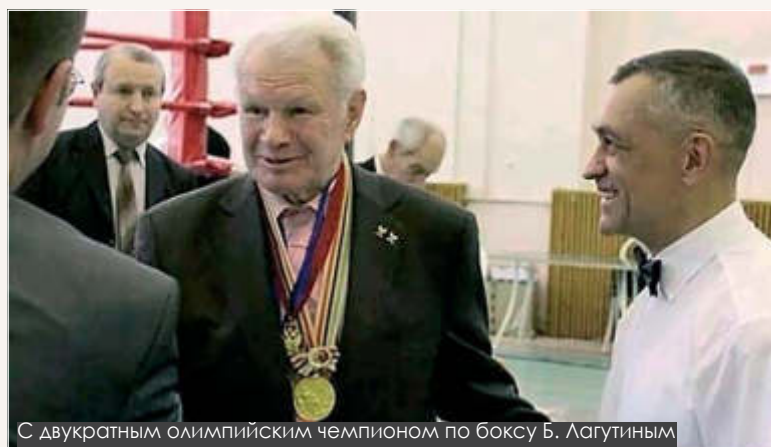
С двукратным олимпийским чемпионом по боксу Б. Лагутиным

– Знаете, нет. Во-первых, именно тот парень тогда, получается, замотивировал меня на успехи в спорте. Во-вторых, когда ты занят своим делом, идешь к своей цели, совершенно отпадает необходимость кому-то что-то доказывать. А настоящий мужчина должен достойно переживать поражения, стремиться к самосовершенствованию, а не мстить.